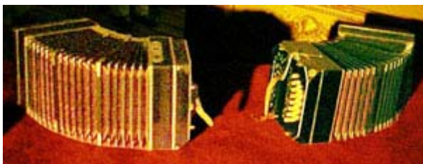
Bandoneones exhibidos el 8 de septiembre en el Salón Dorado de la Casa de la Cultura