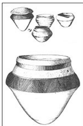
Vasijas Tupiguaraní procedentes del Delta del Paraná, según S. K. Lothrop

Los interesados pueden inscribirse en la Comisión para la Preservación del Patrimonio Histórico Cultural de la Ciudad de Buenos Aires (CPPHC) Av. de Mayo 575 p.5, of. 505. Tel. 4323-9796 o 4323-9400 int. 2772 y 2717 E-mail: patrim_historico@buenosaires.gov.ar